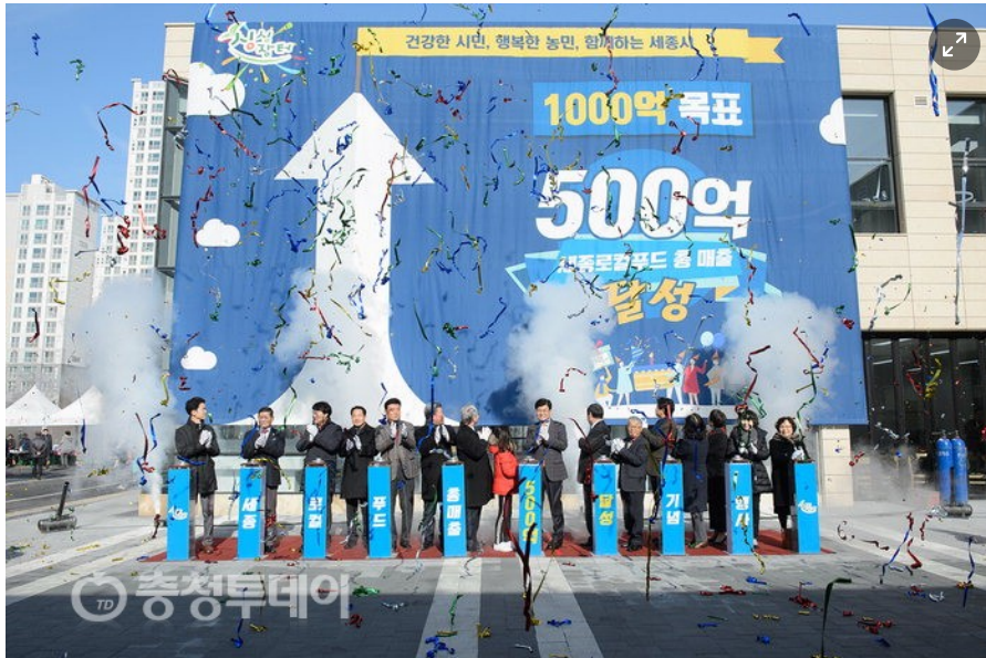
▲ 세종시와 세종로컬푸드(㈜)는 세종로컬푸드(㈜) 총매출액 500억 달성 기념행사를 열었다.

새롬동 입지안 뼈대 유지, 미세조정을 통해 재정위기 극복 안전판 마련 주차타워형 건립계획 접고, 로컬푸드 직매장 중심 복합문화시설 건립 추진