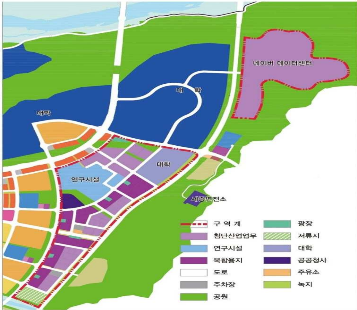
행정중심 복합도시 토지이용계획표