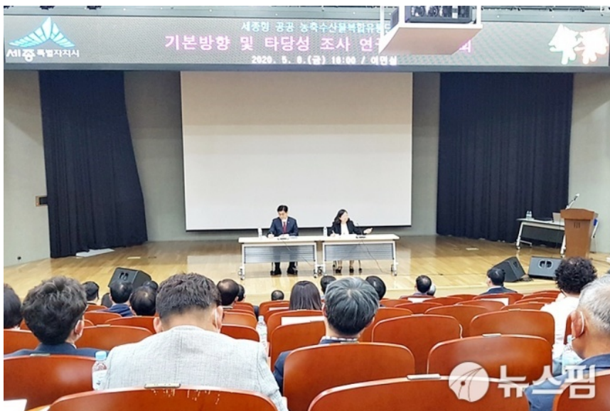
세종시가 지난 8일 시청에서 농축수산물 복합유통단지 기본방향과 타당성 연구용역 중간 보고회를 열었다. 2020.05.16