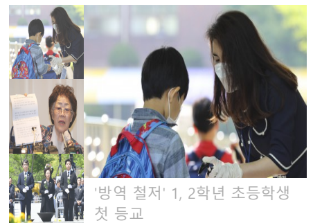
'방역 철저' 1, 2학년 초등학생 첫 등교