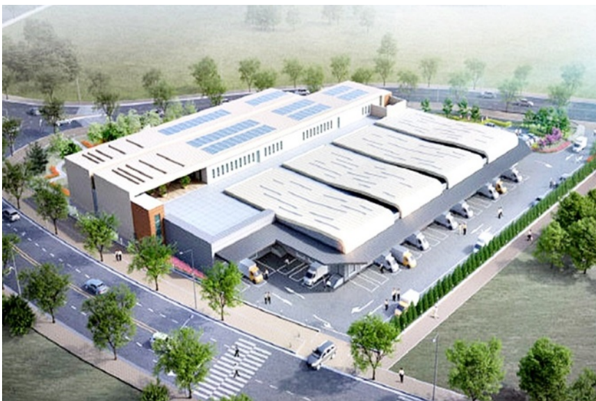
세종시가 4-2생활권 반곡동에 구상중인 농수축산물 복합유통단지 조감도. 2020.05.16

전동면에서 농사를 짓는 A(62) 씨는 "농지가 많은 전동면에 공단이나 폐기물 처리시설 등 혐오시설을 보낼게 아니고, 농수축산물 복합유통단지 같은 6차산업 관련 농업시설을 지어야 할 것"이라고 말했다.