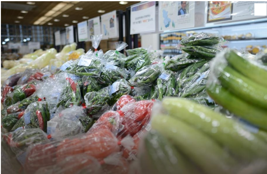
세종시 로컬푸드 직매장 상품 모습.

학생 1인당 쌀 10kg, 현금 3만 원 지급 검토 대상 학생 5만 3000여 명, 조례 제정 추진